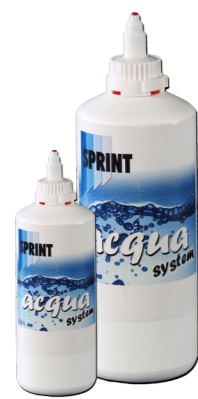
Waterborne Paint System