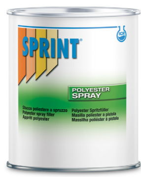
F18 Polyester Spray Filler