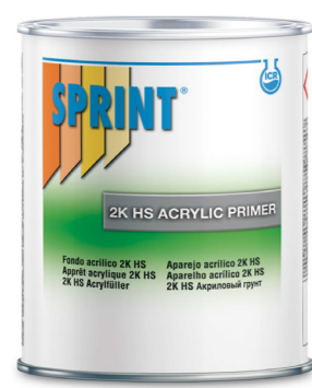
F90/91 • F57/58 • U1/U3 2K HS Primer 5:1