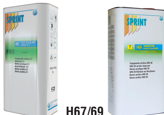
H67/69 UHS Clear 2k 2:1